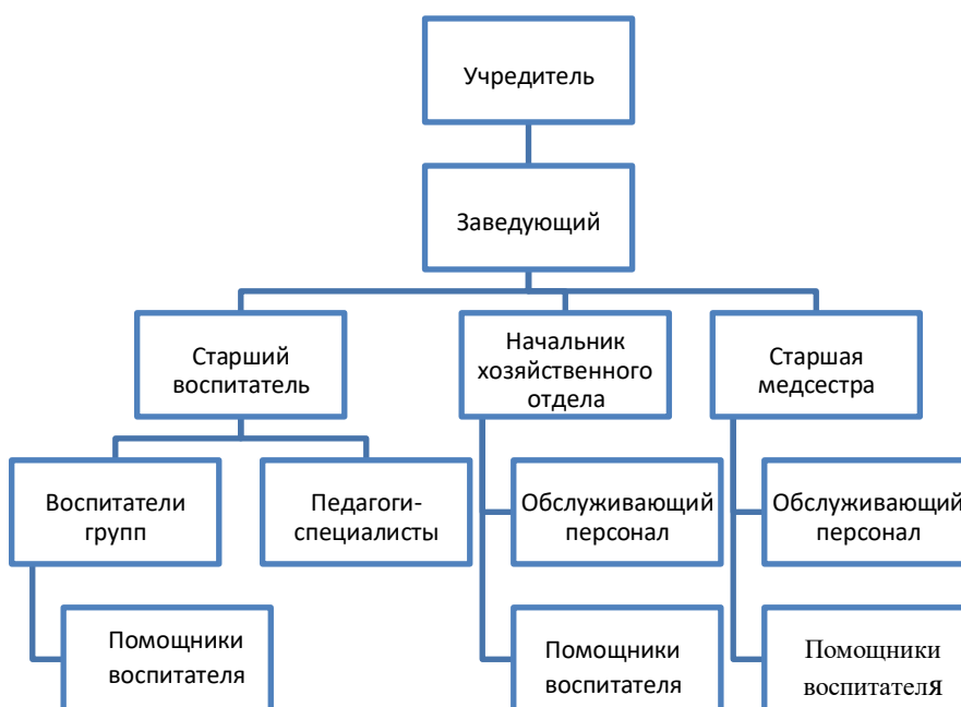
Схема 1. Административное управление МБДОУ.